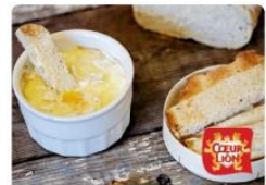
Œuf cocotte au camembert

Pour exploiter pleinement l'interactivité avec leur audience, les marques disposent également d'un espace édito dédié et accessible depuis la recette sponsorisée afin de promouvoir leurs contenus (vidéos, story telling, conseils...).