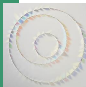
Keiko Mukaide Three Circles of Family Verre dichroïque sur bois

Devenu un rendez-vous attendu dans l'agenda de l'art contemporain, Lille Art Up! prend aujourd'hui une nouvelle dimension. Autour de la thématique de l'année - Transparences & Lumières - l'évènement nourrit son propos en coopération avec l'Université Catholique de Lille, La Piscine et le LaM. Cette première escapade de Lille Art Up! hors de nos murs s'inscrit dans la droite ligne de notre feuille stratégique. Lille Art Up! se festivalise et devient un évènement hybride, dessiné avec les acteurs de notre territoire. Lille Grand Palais joue ainsi plus encore son rôle de porte-drapeau de la destination Lille.