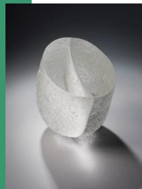
Bernard Dejonghe Meule Vive Verre moulé et poli