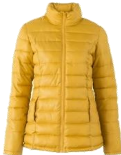
Doudoune courte Moutarde à partir de 59,99 €