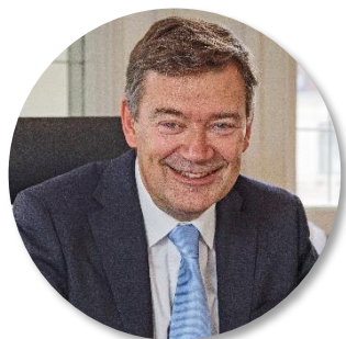
Philippe HOURDAIN Président de la CCI Hauts-de-France

À chaque projet ses solutions. Contactez dès à présent le guichet unique pour les entreprises au 03 74 27 00 27 ou par mail entreprises@hautsdefrance.fr .