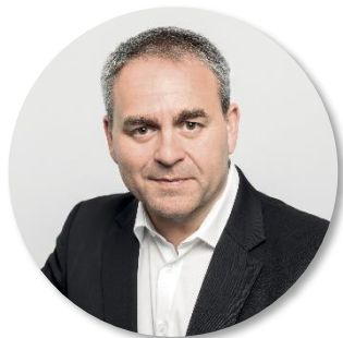
Xavier BERTRAND Président de la Région Hauts-de-France