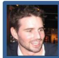
Pierre Paquentin Orangina Suntory France