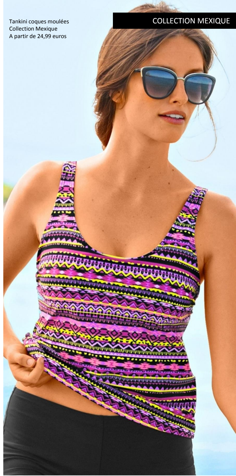
Tankini coques moulées Collection Mexique A partir de 24,99 euros