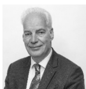
ALAIN GRISET Président de la Chambre régionale de Métiers et de l'artisanat Hauts-de-France

Le salon est un parfait tremplin où j'ai pu rencontrer les personnes nécessaires pour mener à bien mon projet.